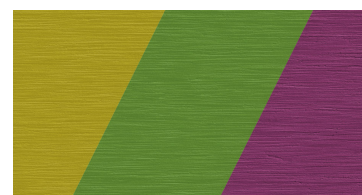
Teinte sur commande