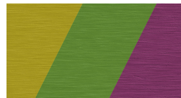
Teinte sur commande